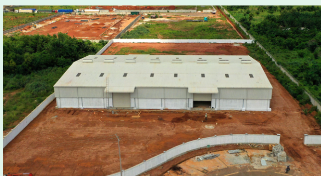
Confort meuble - Fabrication de meuble