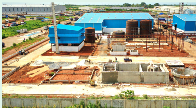
Benin Agribusiness - Transformation de soja