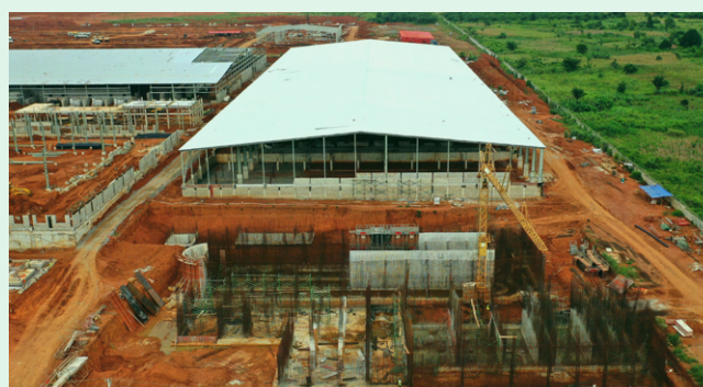
Afrikan Ceramics Solutions