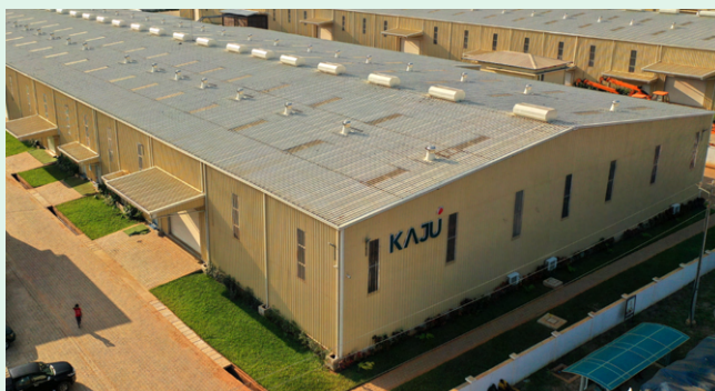
Kaju - Transformation de noix de cajou

Découvrez à travers ces photos, l'état d'avancement des travaux de construction de la Zone Industrielle de Glo-Djigbé Zè-BÉNIN (photos prises en août 2023).