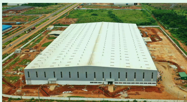
Spiro - Assemblage de moto électrique